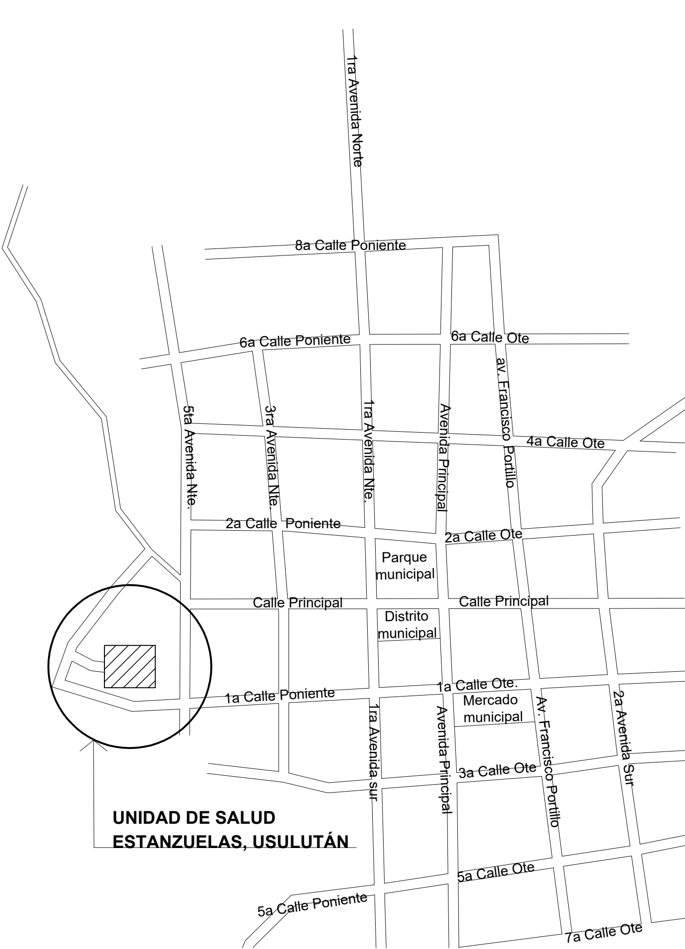
ESQUEMA DE UBICACIÓN UNIDAD DE SALUD ESTANZUELAS, DEPARTAMENTO DE USULUTÁN.